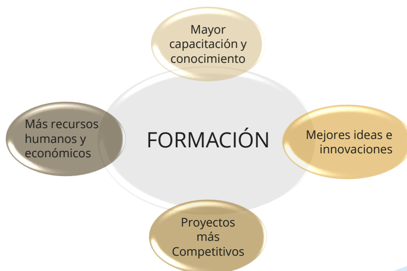
Diagrama 1. Ciclo de valor añadido de la formación.

La investigación e innovación biosanitaria exige la constante actualización de conocimientos y capacidades. La formación facilita la toma de conciencia no sólo como un ejercicio de revisión individual, sino también institucional, para impulsar acciones de mejora y cambio. Este intangible es básico para garantizar la sostenibilidad competitiva de una institución I+D+i como la nuestra, basada en la optimización de recursos económicos y humanos.